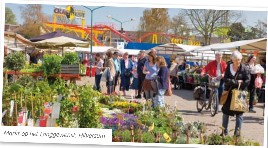
Markt op het Langgewenst, Hilversum